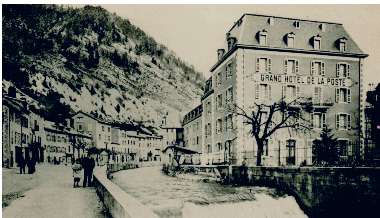
LE GRAND HÔTEL DE LA POSTE — Années 1900

Pour mémoire, voilà 4 ans que l'Hôtel de La Poste a fermé ses portes au public. Une perte pour la commune, de part l'histoire de cet établissement qui a longtemps été prospère, mais aussi pour l'image de Morez qui affiche un établissement fermé au cœur de la ville.